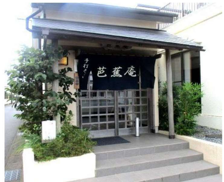
店舗（芭蕉庵）の外観